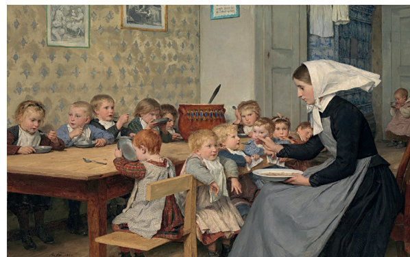
Albert Anker: Die Kinderkrippe, 1890